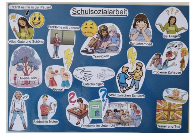
Schülerposter in den Klassen